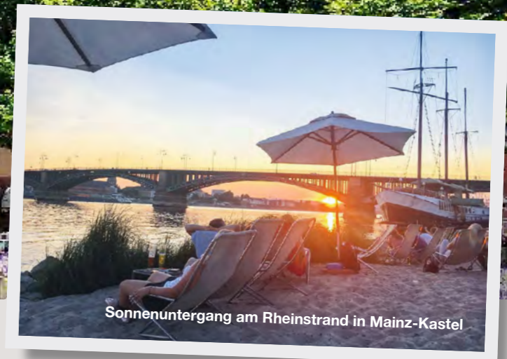
Sonnenuntergang am Rheinstrand in Mainz-Kastel