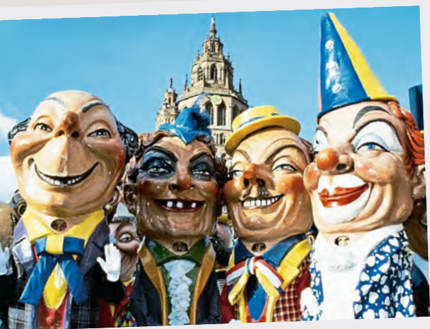
Ohne die „Schwellköpfe“ geht am Rosenmontagszug gar nichts

Mainz: Die Domstadt am Rhein punktet mit Wein, Gemütlichkeit und viel Historie