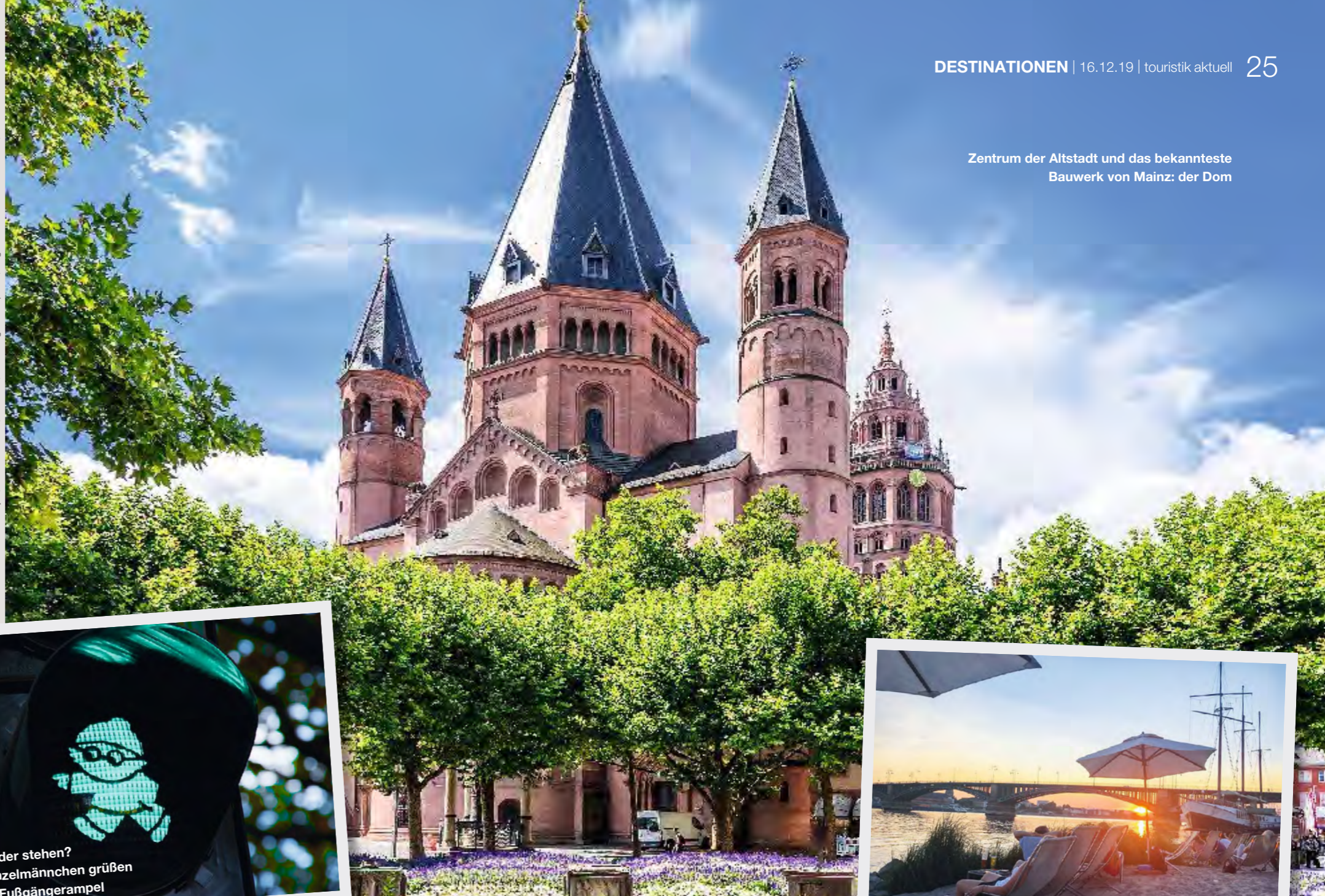
Zentrum der Altstadt und das bekannteste Bauwerk von Mainz: der Dom