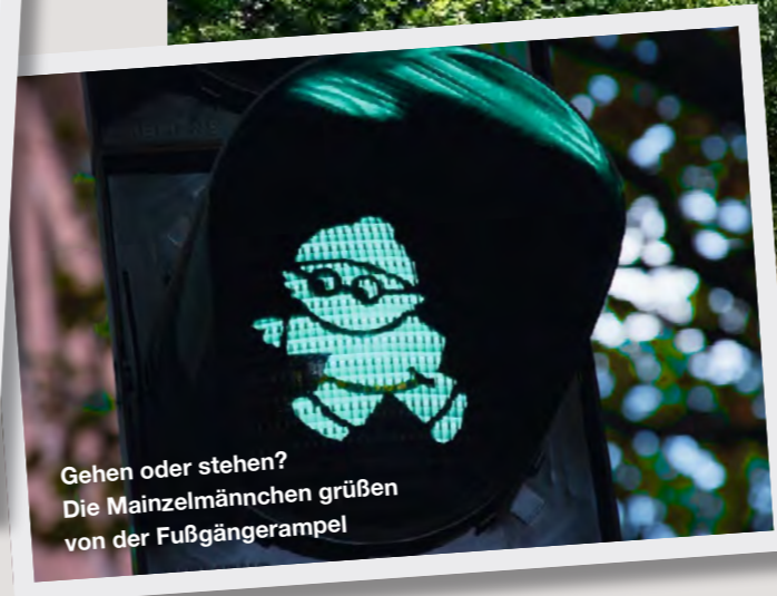
Gehen oder stehen? Die Mainzelmännchen grüßen von der Fußgängerampel

Das schönste Fest ist der Weinmarkt im Stadtpark. Er findet immer am letzten August- und ersten Septemberwochenende statt. Einmal die Gaustraße hochlaufen: Die steilste Straßenbahnstrecke Deutschlands verbindet den Schillerplatz mit der Oberstadt. Ganz unten gibt es mit dem „Shakespeare und so“ die beste Buchhandlung der Stadt, im Café „Dicke Lilli“ den besten Karottenkuchen und gute Suppen. Der Mainzer liebt sein samstägliches Marktfrühstück vor dem Dom. Der Klassiker: Weck, Worscht und Woi. Wer drauf steht: An vielen Metzgerständen gibt es eine Tasse Wurstsuppe gratis zur Bestellung dazu.